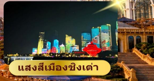
แสงสีเมืองชิงเต่า