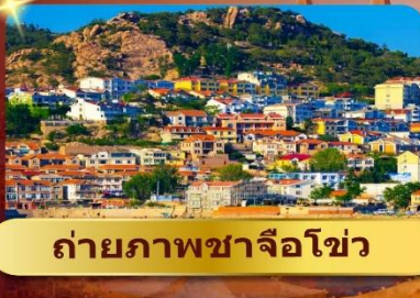
ถ่ายภาพซาจือໂ໑ว