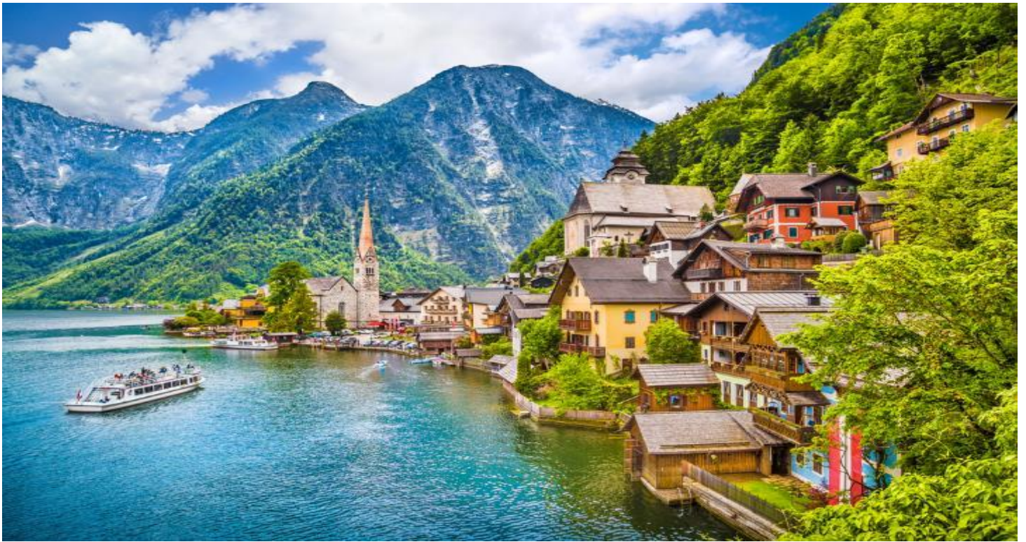
กลางวัน รับประทานอาหารกลางวัน ณ ภัตตาคารพื้นเมือง (ปลาจากทะเลสาบฮัลสตัท)