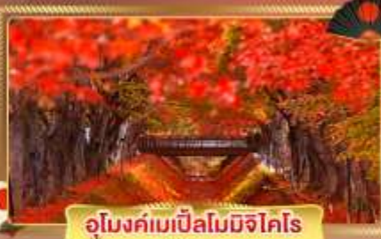
อุโมงค์เมเปิ้ลโมมิจิโคโระ