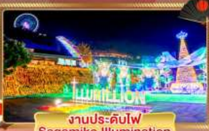
งานประดับไฟ Sagamiko Illumination