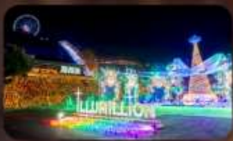
งานประดับไฟ/ Sagamiko Illumination