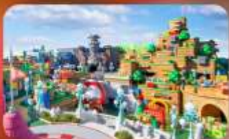
อิสระท่องเที่ยว