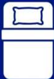
ห้องพักเดี่ยว SINGLE BED ROOM (SGL)

ห้องพักสำหรับ 1 ท่าน มีค่าใช้จ่ายเพิ่มจากค่าทัวร์