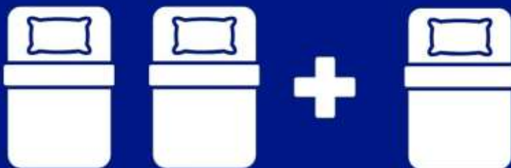
ห้องพักสำหรับสามท่าน (ที่นอนเสริม) TRIPLE BED ROOM (TRP)