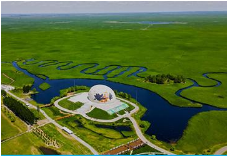
อุทยานชุ่มชื้นจาหลง

รับประทานอาหารเช้า ณ ห้องอาหารของโรงแรม (7)