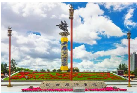
จัตุรัสเจงกิสข่าน

หลังอาหารนำท่านเดินทางสู่เมือง ไห่ลาเอ๋อ 海拉尔市 (ระยะทาง 456 กม. ใช้เวลาเดินทางราว 5 ชั่วโมงครึ่ง)