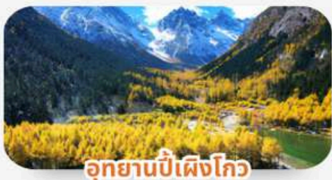
อุทยานปีศาจโกว

ราคาเริ่มต้นท่านละ 42,999 🗓️ เดินทาง : กันยายน - พฤศจิกายน 69