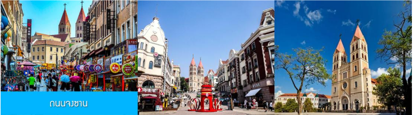
ถนนนางซาบ