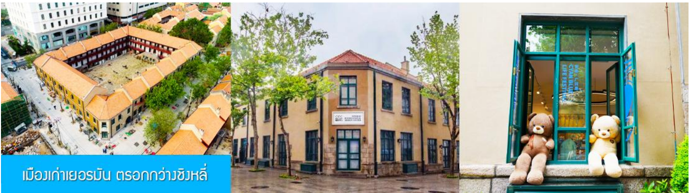
เมืองเก่าเยอรมัน ตรอกกว้างชิงหลี