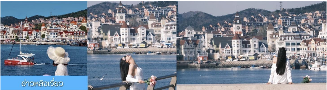
อ่าวหลังเจี๊ว