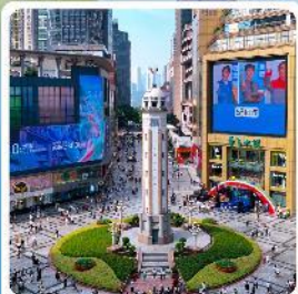
ถนนเจี่ยฟางเปี่ย