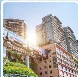
รถไฟฟหะลุดึก