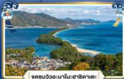
จุดชมวิวกะมาโอะฮาชิคาตะ