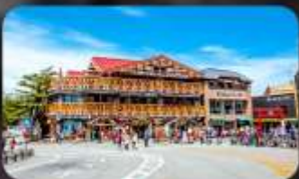
ฟูจิชั้น 5

INTERNATIONAL RESORT HOTEL YURAKUJO MARITA หรือเทียบเท่ามาตรฐานญี่ปุ่น