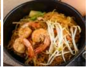
CHAR HWAY TEOW

หรือท่านสามารถซื้อทัวร์เสริมของทางเรือ (ก่อนถึงปีนัง 1 วัน ที่เคาน์เตอร์ขายทัวร์เสริมบนเรือ) เจ้าหน้าที่จะทำการนัดหมายในการลงเรือกับท่านในวันรุ่งขึ้น