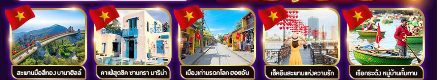
สะพานมือสีทอง บานาฮิลล์ คาเฟ่สุดชิค ซานทรา มาริน่า เมืองเก่ามรดกโลก ฮอยอัน เช็คอินสะพานแห่งความรัก เรือกระด้ง หมู่บ้านกิมกาน