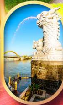
คาร์พดราท้อน