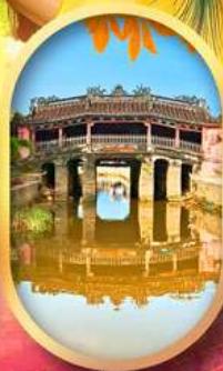
เมืองเก่าฮอยอัน