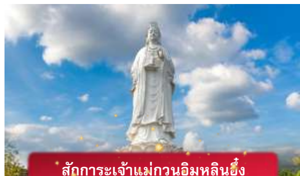
สักการะเจ้าแม่กวนอิมหลินอึ้ง