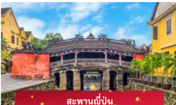
สะพานญี่ปุ่น