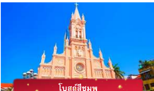
โบสถ์สี่ชมพู

ค่ำ บริการอาหารค่ำ ณ ภัตตาคาร พิเศษ ... เมนูบุฟเฟ่ปิ้งย่าง ที่พัก MAGNOLIA HOTEL เทียบเท่าหรือระดับ 4 ดาวท้องถิ่น