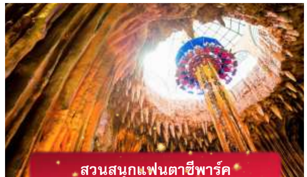
สวนสนุกแฟนตาซีพาร์ค

อิสระท่านท่องเที่ยว สวนสนุกแฟนตาซีพาร์ค ซึ่งมีเครื่องเล่นหลากหลายรูปแบบ เช่น ทำทายความมันส์ของหนัง 4D ระทึกขวัญกับบ้านผีสิง เกมส์สนุกๆ เครื่องเล่นเบาๆ รถบั๊ม หรือจะเลือกซื้อป๊อปปิ้งของที่ระลึกของสวนสนุก และ จัตุรัสแห่งดวงดาว เปรียบเสมือนการเดินทางสู่อาณาจักรแห่งดวงดาว ที่มีเส้นทางเชื่อมต่อระหว่างอาณาจักรแห่งดวงจันทร์และอาณาจักรแห่งดวงอาทิตย์ถนนที่แสนงดงาม และสถาปัตยกรรมที่ล้ำสมัยจุดเด่นของที่แห่งนี้ก็คือกระจกใสทรงสามเหลี่ยมที่ดูคล้ายกับพิพิธภัณฑลู่ฟวร์ที่ฝรั่งเศส ให้ความรู้สึกเหมือนท่านกำลังท่องอยู่ในโลกแห่งเวทมนต์และดวงดาว (ไม่รวมค่าเข้าชมหุ่นขี้ผึ้ง)