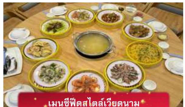
เมนูซีฟู้ดสไตล์เวียดนาม

17.05 เดินทางถึง สนามบินสุวรรณภูมิ โดยสวัสดิภาพ ... พร้อมความประทับใจ