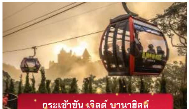
กระเช้าขึ้น เวิลด์ บานาฮิลล์

เที่ยง อีสรอาหารกลางวันเพื่อความสะดวกในการท่องเที่ยว