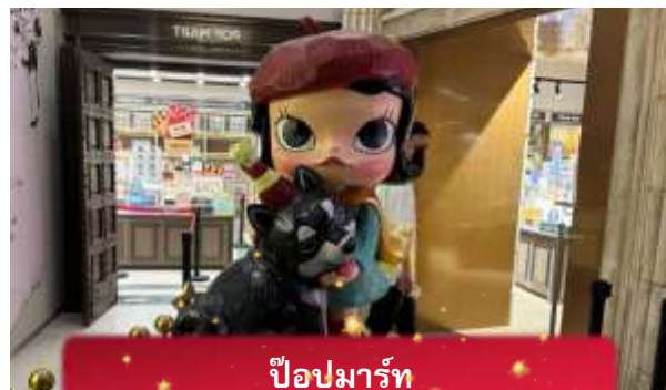
ป๊อปมาร์ท