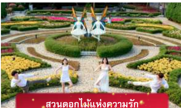
สวนดอกไม้แห่งความรัก