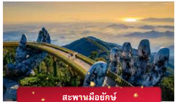
สะพานมียักษ์

นำท่านชม สะพานมียักษ์ แหล่งท่องเที่ยวใหม่ล่าสุดซึ่งอยู่บนเขาบานาฮิลล์ เป็นสะพานสีทองทอดยาวโดยมีมือ 2 ข้างอุ้มไว้ ตั้งอยู่ในตำแหน่งที่โดดเด่นเห็นชัด สวยงาม นำท่านชม สวนดอกไม้แห่งความรัก เป็นสวนดอกไม้สไตล์ฝรั่งเศส ที่มีดอกไม้หลากหลายพันธุ์ถูกจัดเป็นสัดส่วนอย่างสวยงามท่ามกลางอากาศที่แสนเย็นสบาย นำท่านชม สักการะพระพุทธรูปหลินอึ้ง เป็นพระพุทธรูปหินองค์ใหญ่ตั้งตระหง่านบนยอดเขาแห่งนี้ ให้ท่านได้ขอพรเพื่อความเป็นมงคล นำท่านชม ป๊อปมาร์ท เป็นร้านค้าของเล่นเปิดใหม่ล่าสุดที่อยู่บนยอดเขาบานาฮิลล์ มีสินค้าของเล่นสำหรับนักกลุ่มมากมายให้ท่านได้เลือกชมกับตัวละครน่ารัก อาทิเช่น Molly, SkullPanda, Labubu หมายเหตุ: การจัดการ และข้อกำหนดในการเข้าชมสินค้าอยู่นอกเหนือการจัดการของบริษัททัวร์