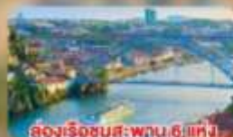
ล่องเรือชมสะพาน 6 แห่ง ในคูร์เมืองปอร์โต