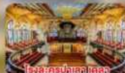
โรงละครบัลเลต์ เดลา มูสิคก้า คาตาลา