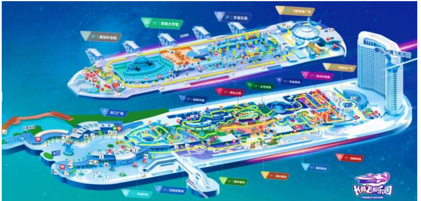
แผนที่ CHIMELONG SPACESHIP PARK