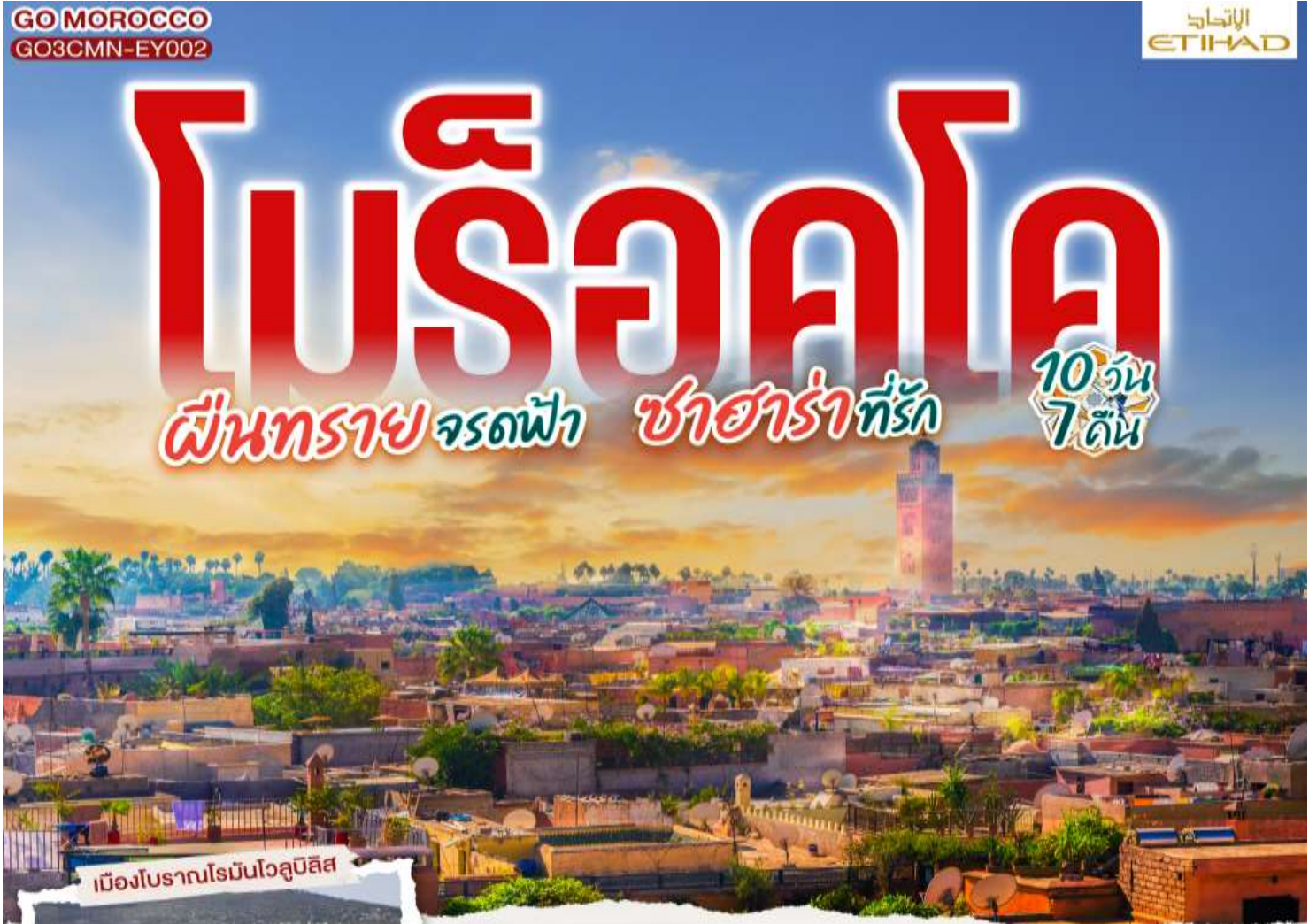
เมืองโบราณโรมันโวลูบิลิส