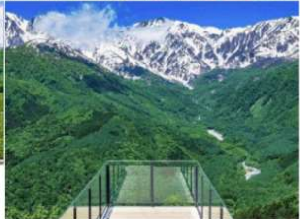
HAKUBA MOUNTAIN HARBOR THE CITY BAKERY