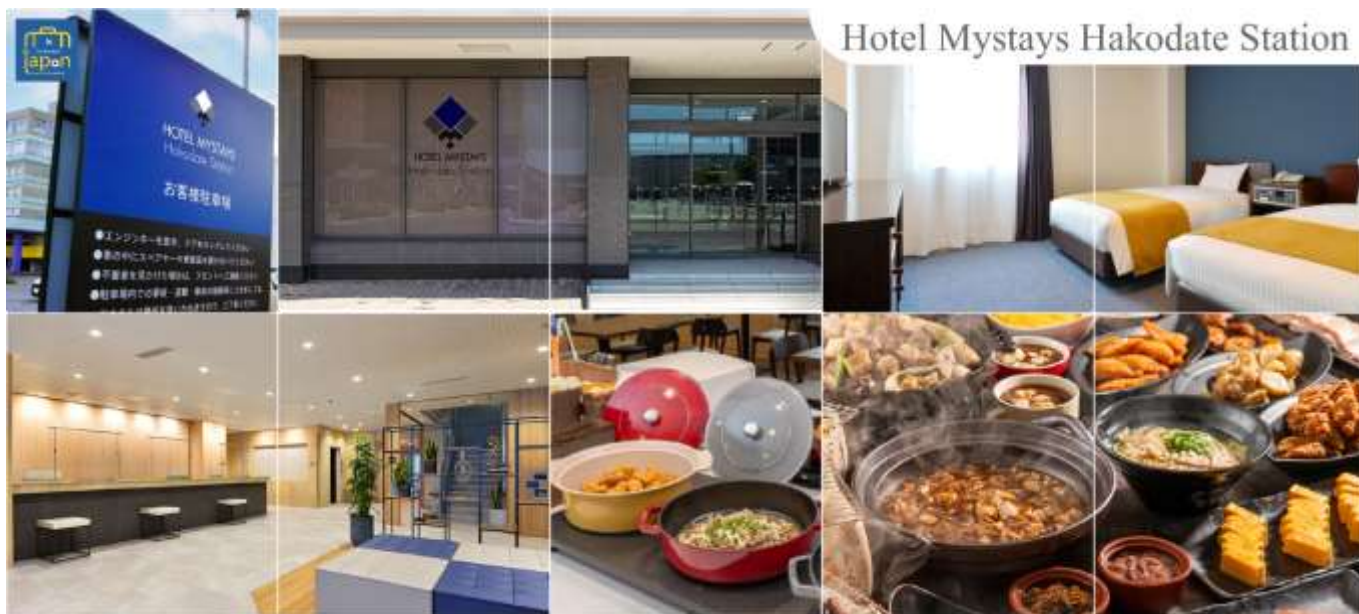
Hotel Mystays Hakodate Station

HOTEL MYSTAYS HAKODATE STATION, HAKODATE หรือเทียบเท่าระดับเดียวกัน