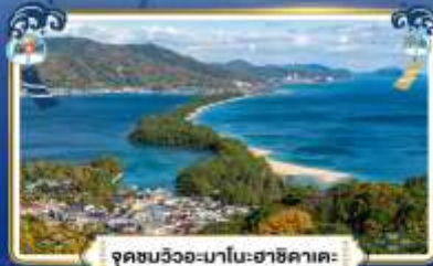
จุดชมวิวกะมาโมะฮาชิคาตะ