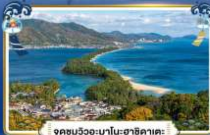
จุดชมวิวกะมาโมะฮาชิคาตะ