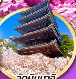
วัดนินนากิ