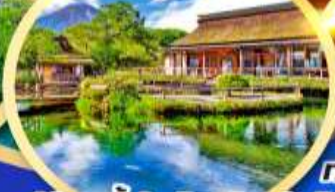
หมู่บ้านน้ำใสโอชิโนะฮัทสึโกะ