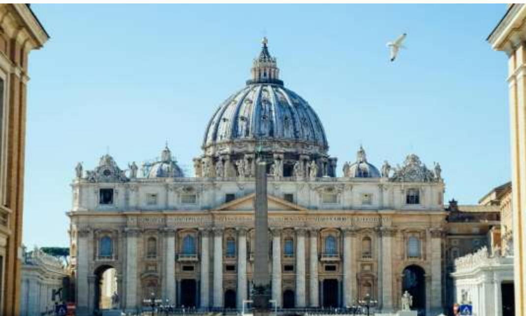
มหาวิหารนักบุญปีเตอร์ ( ST. PETER' BASILICA)

(กรณีมีพิธีด้านใน หรือถ้าหากมีผู้เข้าชมเป็นจำนวนมากจนไม่สามารถเข้าชมได้ทันเวลา ทั้งนี้เพื่อมิให้กระทบต่อกำหนดการท่องเที่ยวอื่นๆ ภายในโปรแกรมทัวร์" อาจจะไม่ได้รับการเข้าชม)