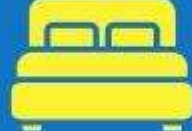
ห้องพักเตียงมัลติ DOUBLE