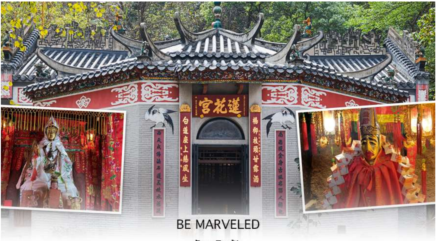
BE MARVELED วัดหลินฟ้า

เที่ยว ๑๐ | รับประทานอาหารเที่ยง ที่ภัตตาคาร