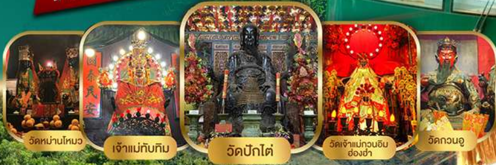
วัดหมู่บ้านโหมง