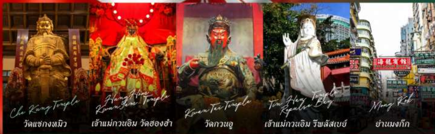
Che Kung Temple วัดแชกงงทมิว

รายการทัวร์ข้างต้นอาจมีการปรับเปลี่ยนเพื่อความเหมาะสม