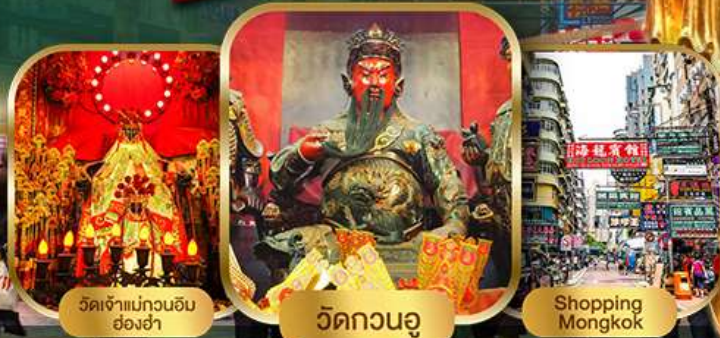
วัดเจ้าแม่กวนอิม อ่องซ่า วัดกวนอู Shopping Mongkok