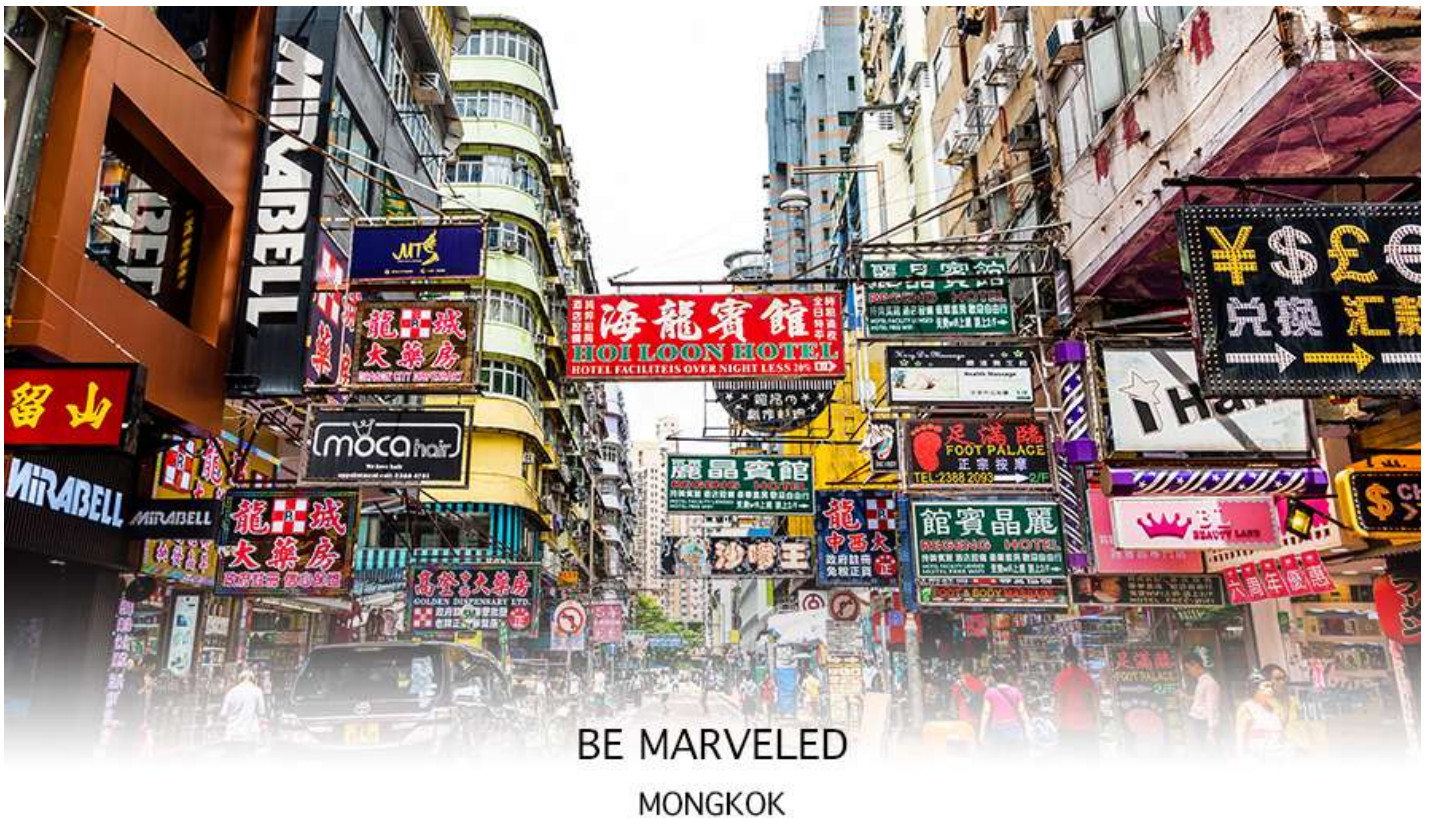
BE MARVELED MONGKOK

นำท่านเดินทาง ผ่านเส้นทางไฮเวย์อันทันสมัยข้ามสะพานแขวนชิงหม่า (TSING MA BRIDGE) ซึ่งเป็นสะพานแขวนสองชั้นที่ยาวที่สุดในโลก โดยมีความยาวทั้งหมด 2.2 กิโลเมตร (1.4 ไมล์) เชื่อมต่อระหว่างฮ่องกงอินเตอร์เนชั่นแนลแอร์พอร์ตกับตัวเมืองฮ่องกง ตัวสะพานชั้นบนจะเป็นทางให้รถยนต์วิ่ง ส่วนชั้นล่างเป็นเส้นทางของเอ็มทีอาร์ (MTR) และแอร์พอร์ตเอ็กเพรสเทรนส์ (AIRPORT EXPRESS TRAINS) สะพานชิงหม่านี้ ได้ถูกคัดเลือกให้เป็นสัญลักษณ์ของคู่รักทั่วโลกอีกด้วย