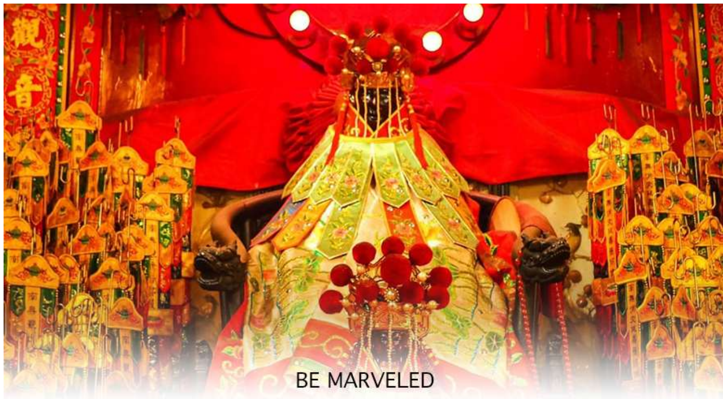
BE MARVELED วัดเจ้าแม่กวนอิมฮองฮำ (ยิมเงิน)

ฉะนั้นการมาบูชาขอพรท่าน จะช่วยเสริมดวงไม่ให้เพลิงพล้ำแก่ศัตรู ทำให้มีมิตรที่ซื่อสัตย์ และคุ้มครองบริวารให้ก้าวหน้า และอยู่เย็นเป็นสุข ซึ่งผู้ประกอบอาชีพ ตำรวจ ทหาร และ นักการเมือง จึงมักจะนิยมบูชาเทพเจ้ากวนอู เป็นพิเศษ