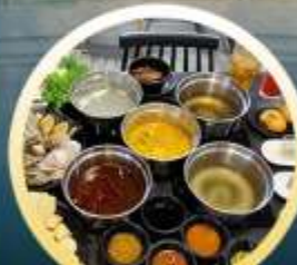
ชาบูฮ่องกง

02-04 มิ.ย. 18-20 มิ.ย. 07-09 มิ.ย. 20-22 มิ.ย. 13-15 มิ.ย. 25-27 มิ.ย. 14-16 มิ.ย. 28-30 มิ.ย.