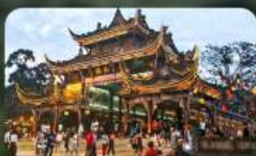
เมืองโบราณกวนเสี้ยน