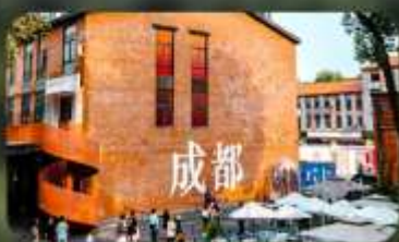
ดงเจียวจี้

HOLIDAY INN EXPRESS HOTEL หรือเทียบเท่า 4 คาว