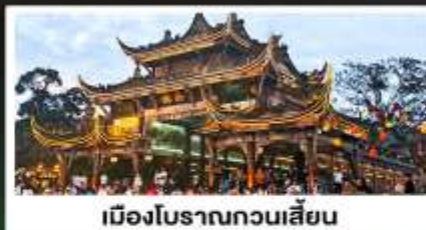
เมืองโบราณทวนเสียน