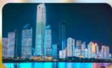
หาดโซเบอร์ฟังก์