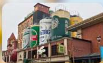
โรงงานเบียร์ชิงเต่า