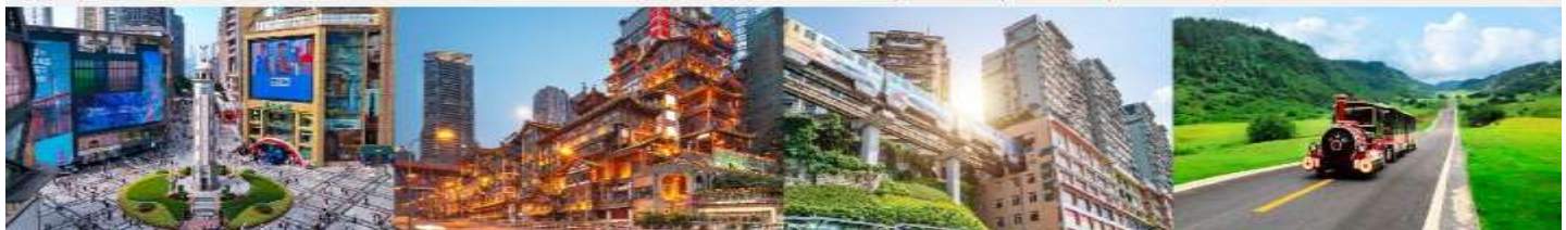
ถนนเจี๋ยฟางเป่ย์