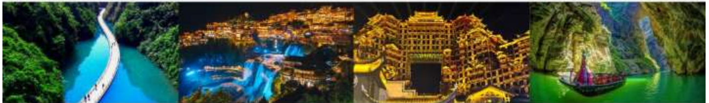
ขุนเขาสิงโต