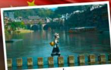
หมู่บ้านเฟิ่งทง

สุดคุ้ม!! พัก 5 ดาว ทุกคืน มนตร์เสน่ห์เมืองเก่า ริมสาងน้ำแจ่มใสแดน