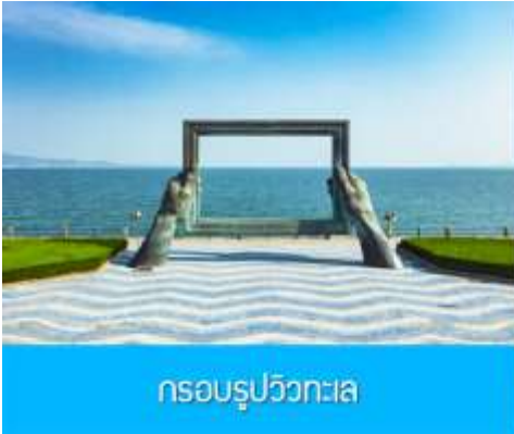
กรอบรูปวิวทะเล