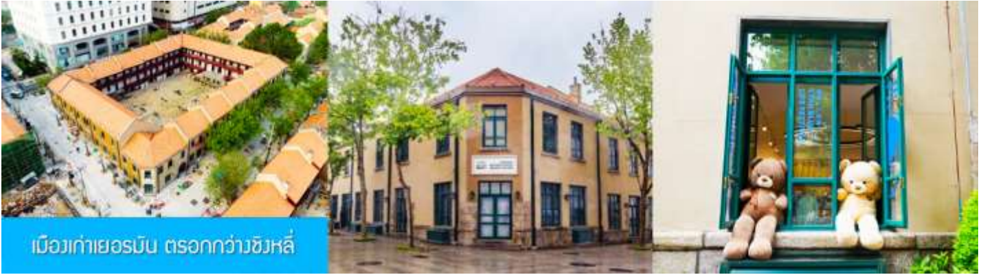
เมืองเก่าเยอรมัน ตรอกกว้างชิงหลี่

จากนั้นเดินทางต่อสู่ย่าน เมืองเก่าเยอรมัน ตรอกกว้างชิงหลี่ 广兴里 ตรอกซอกซอยที่เรียงรายไปด้วยอาคารสถาปัตยกรรมแบบผสมผสานแบบจีนและอาคารสไตล์ยุโรป