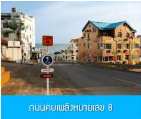
ถนนคอบเพลิงหมายเลข 8

นำท่านชมสวนสาธารณะ威海公园 สวนสาธารณะริมทะเลที่ใหญ่ที่สุดของเมือง威海 ให้ท่านชมและถ่ายภาพคู่กับ กรอบรูปยักษ์วิวทะเล 威海公园大相框 แลนด์มาร์คที่เป็นอีกหนึ่งไฮไลท์ที่ฮิตของเมือง威海