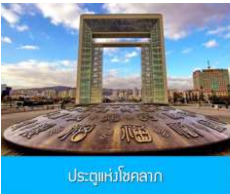
ประตูแห่งโชคกลาง