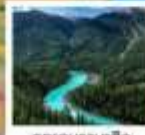
อุทยานคานาสือ