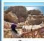
เขตพิศาจทะเล