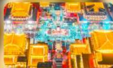
ถนนวัฒนธรรมต้าถิง