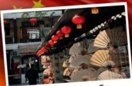
ถนนโบราณซูหยวนเหมิน

"มรดกโลกพันปี สุสานทหารดินเผา" แต่งชุดจีนโบราณ เดินถนนวัฒนธรรมต้าถิง