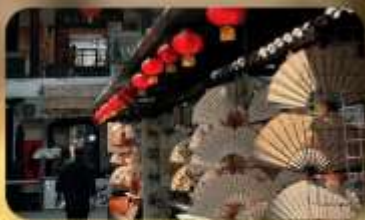
ถนนโบราณซูหยวนเหมิน