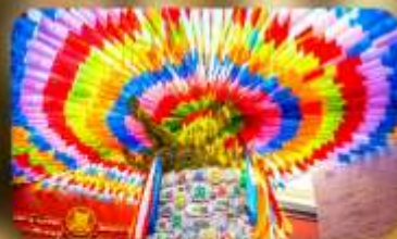
วัดลามะกว้างเหริน