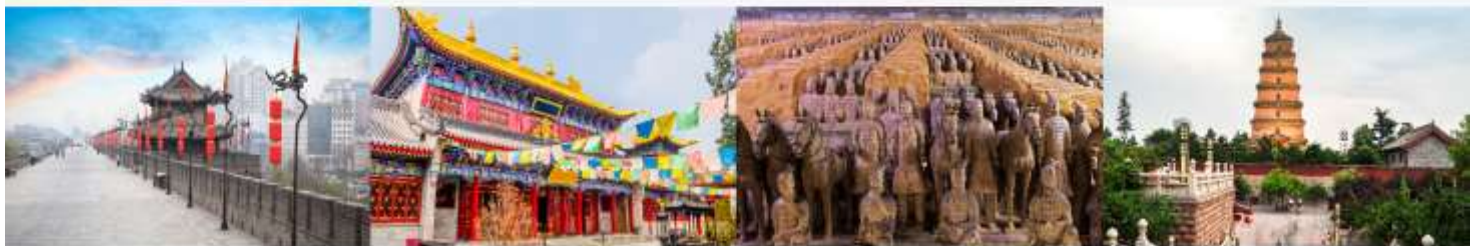
กำแพงเมืองโบราณ