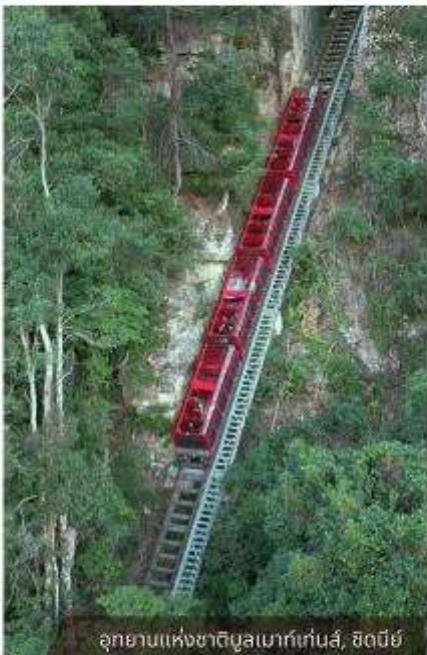
อุทยานแห่งชาติบลูเมาท์เทนส์, ซิดนีย์