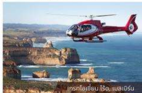
เฮลิคอปเตอร์บิน, เมลเบิร์น