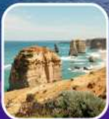
Great Ocean Road (ครึ่งสาย)