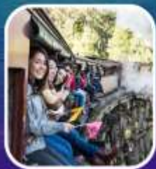
รถไฟจักรไอน้ำโบราณ