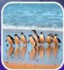
เพนกวินที่เกาะฟิลลิป