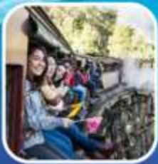
รถไฟจักรไอน้ำโบราณ