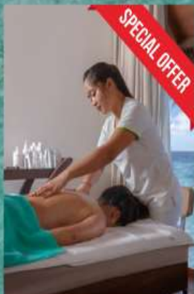
SPA 30 mins