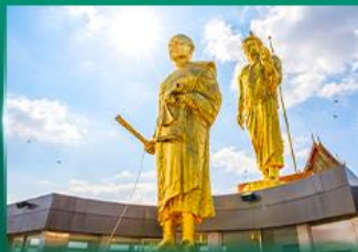
หลวงพ่อคูณ วัดบ้านไร่